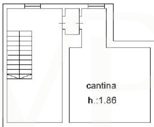
PIANO 1 SOTOSTRADA

Esta planta não é à escala. Os documentos foram-nos entregues pelo cliente. Por conseguinte, não podemos assumir qualquer responsabilidade pela exatidão das indicações.