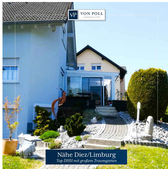
Nähe Diez/Limburg Top DHH mit großem Traumgarten