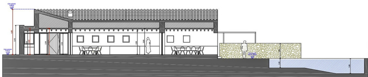
SECCIÓN 1 E: 1/150