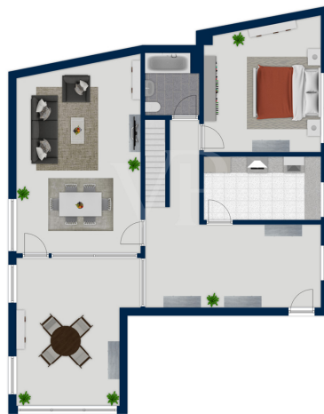
Exposplan, nicht maßstäblich