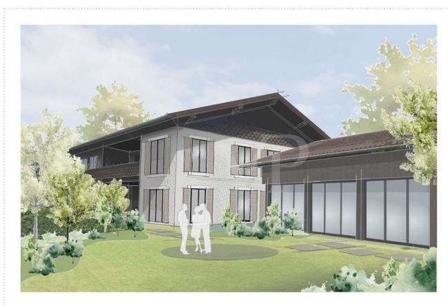
Perspektive - Fassadenstudie_V2