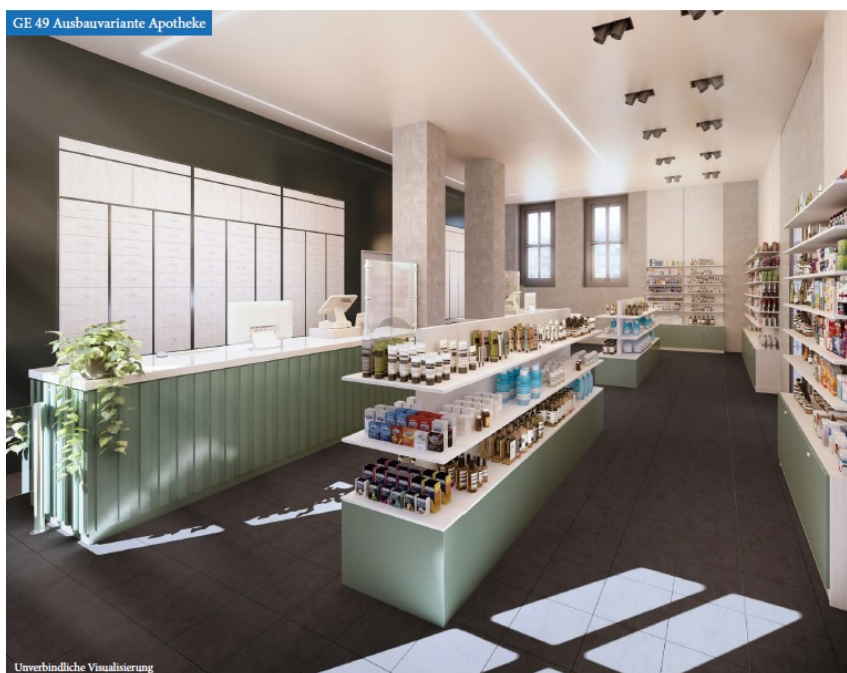
GE 49 Ausbauvariante Apotheke