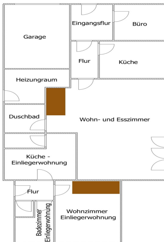
Grundriss Erdgeschoss Achtung unmaßstäbliche Angaben