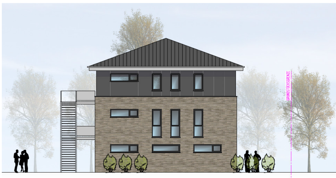
HAUS 3 ANSICHT VON NORDEN | M100