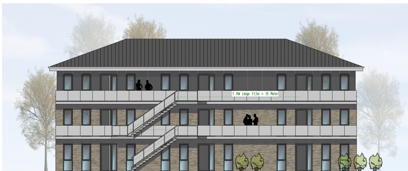
HAUS 3 ANSICHT VON OSTEN | M100