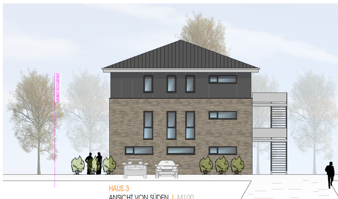
HAUS 3 ANSICHT VON SÜDEN | M100