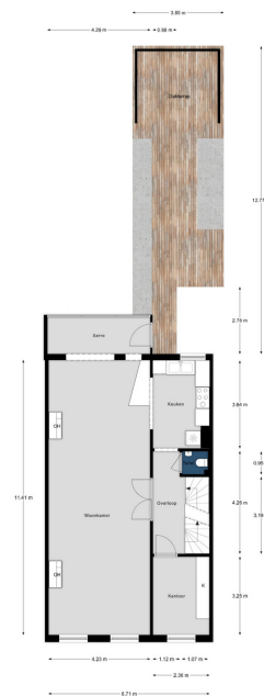
Alphenstraat 60, Den Haag | 1e Verdieping H = 3,13 m