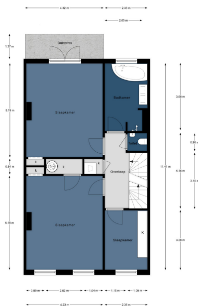
Alphenstraat 60, Den Haag | 2e Verdieping H = 2,98 m