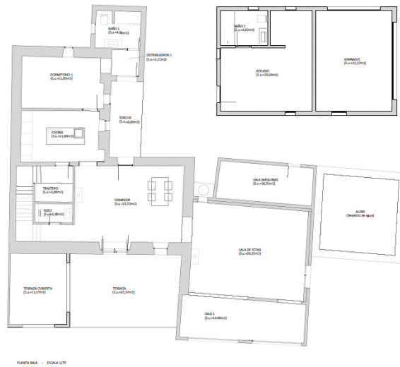
PLANTA SEGUNDA - ESCALA 1/25