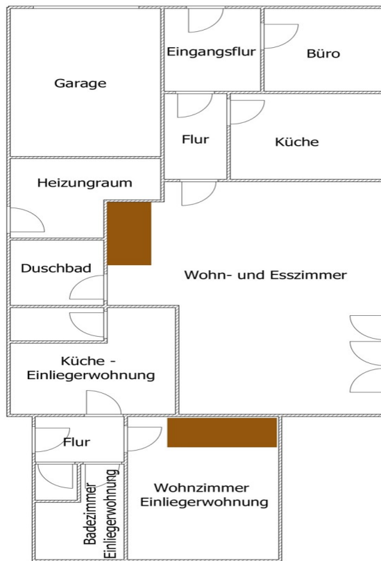
Grundriss Erdgeschoss Achtung unmaßstäbliche Angaben