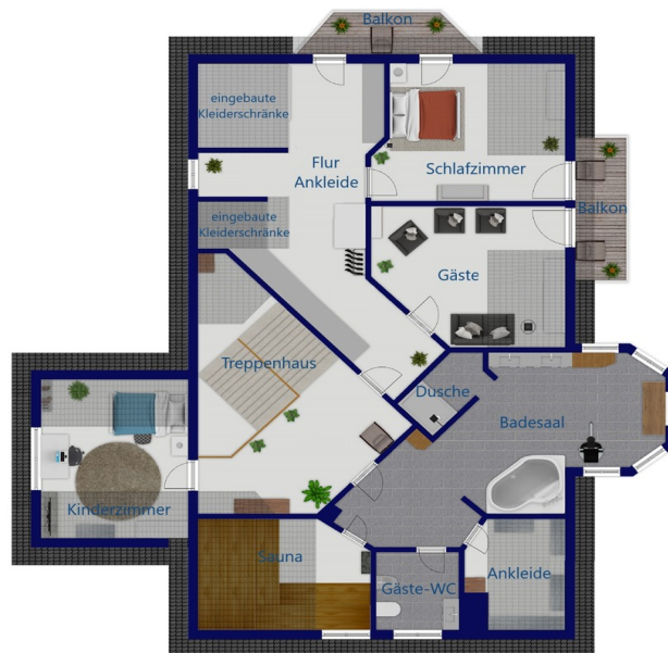
Exposéplan, nicht maßstäblich

???? ? ?????? ??? ?????? ?? ????????. ?? ??????? ???? ??????? ???? ???? ???????, ??? ?? ???? ?????, ??? ?????????? ?? ??????????? ???? ?????????? ??? ??????????????