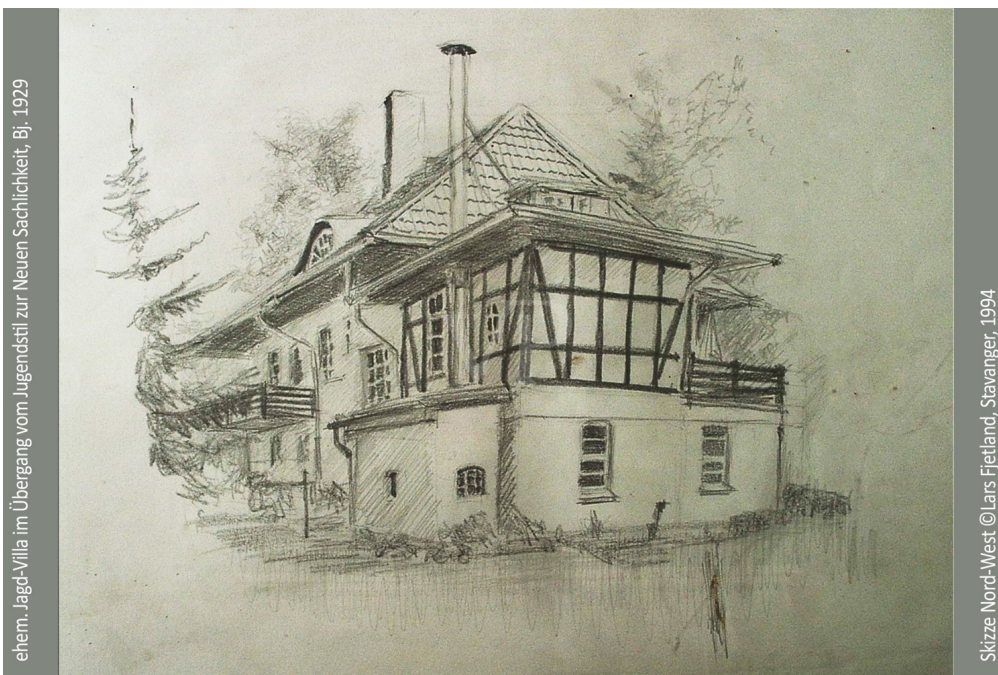
ehem. Jagd-Villa im Übergang vom Jugendstil zur Neuen Sachlichkeit, Bj. 1929