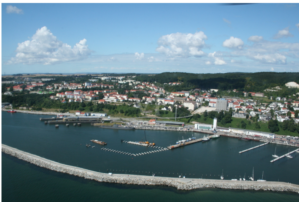
Neubau Apartment Hotel