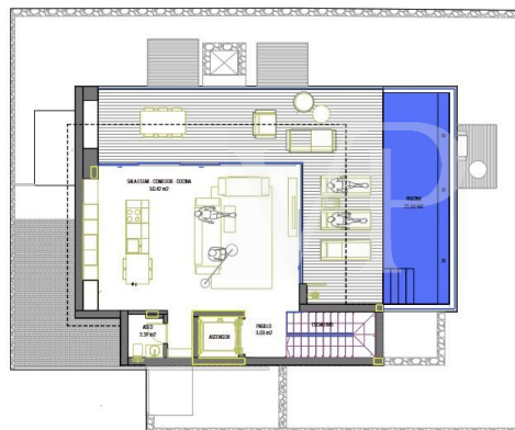
Parcela 31 Planta Alta