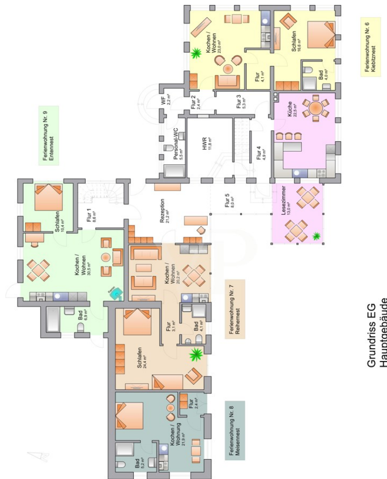
Grundriss EG Hauptgebäude