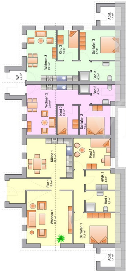
Grundriss EG Nebengebäude