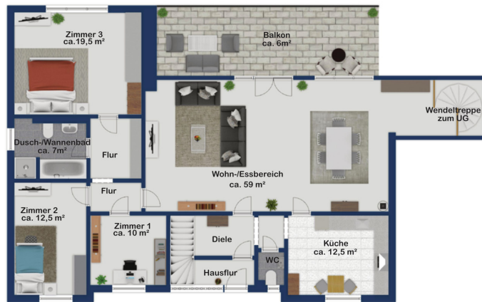
Exposé plan, nicht maßstäblich