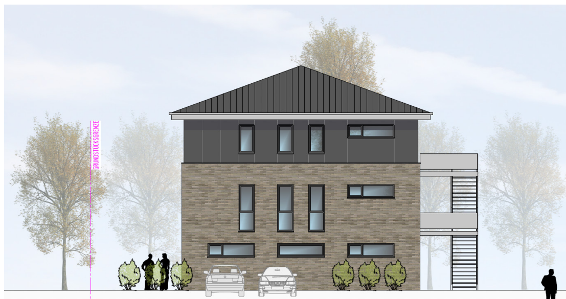
HAUS 3 ANSICHT VON SÜDEN | M100