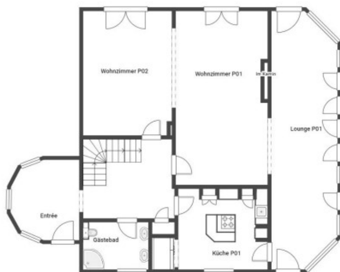
Erdgeschoss inkl. Atelier