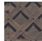
Perspektive - Fassadenstudie_V3