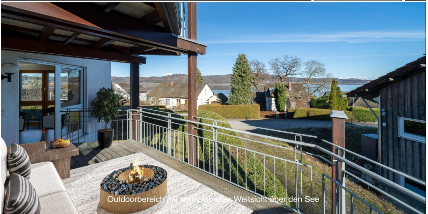
Outdoorbereich mit sensationeller Weitsicht über den See