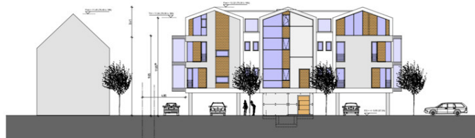
Ansicht Nord-Ost Variante 20°/20°