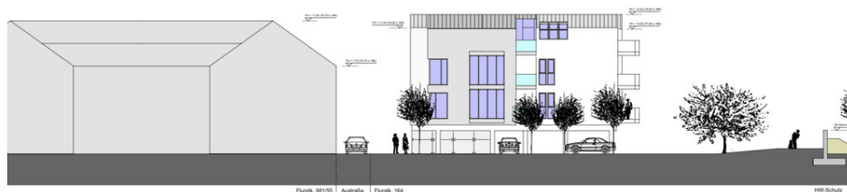
rd-West ≈ 20°/20°