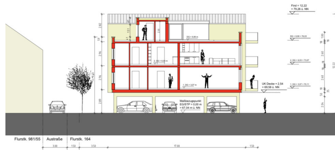
Schnitt 1-1 mit Flachdach im Bereich der Wohnungseingänge im DG