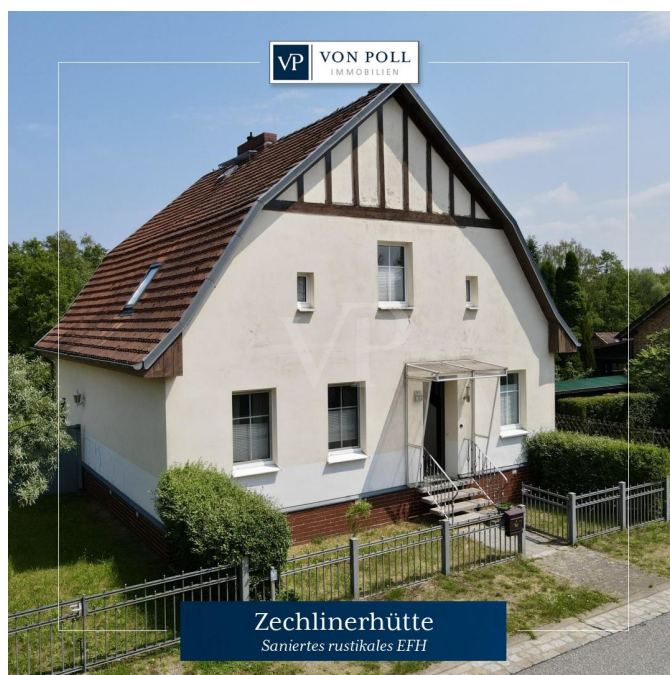
Zechlinerhütte Saniertes rustikales EFH