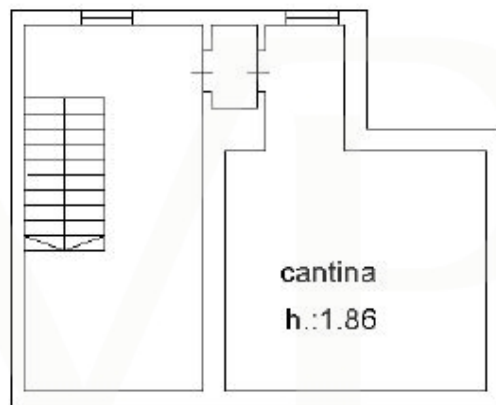
PIANO 1 SOTOSTRADA

Dieser Grundriss ist nicht massstabsgetreu. Die Unterlagen wurden uns vom Auftraggeber zur Verfügung gestellt. Aus diesem Grund können wir nicht für die Richtigkeit der Angaben garantieren.