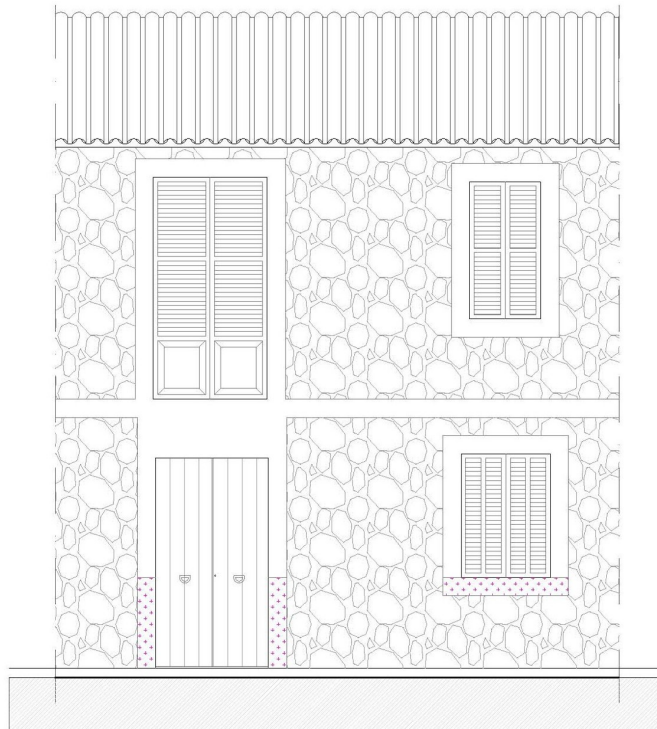
ESTADO REFORMADO - FACHADA PRINCIPAL