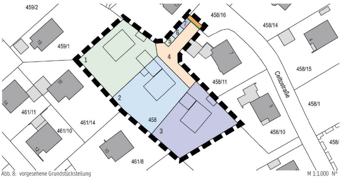
Abb. 8: vorgesehene Grundstücksteilung