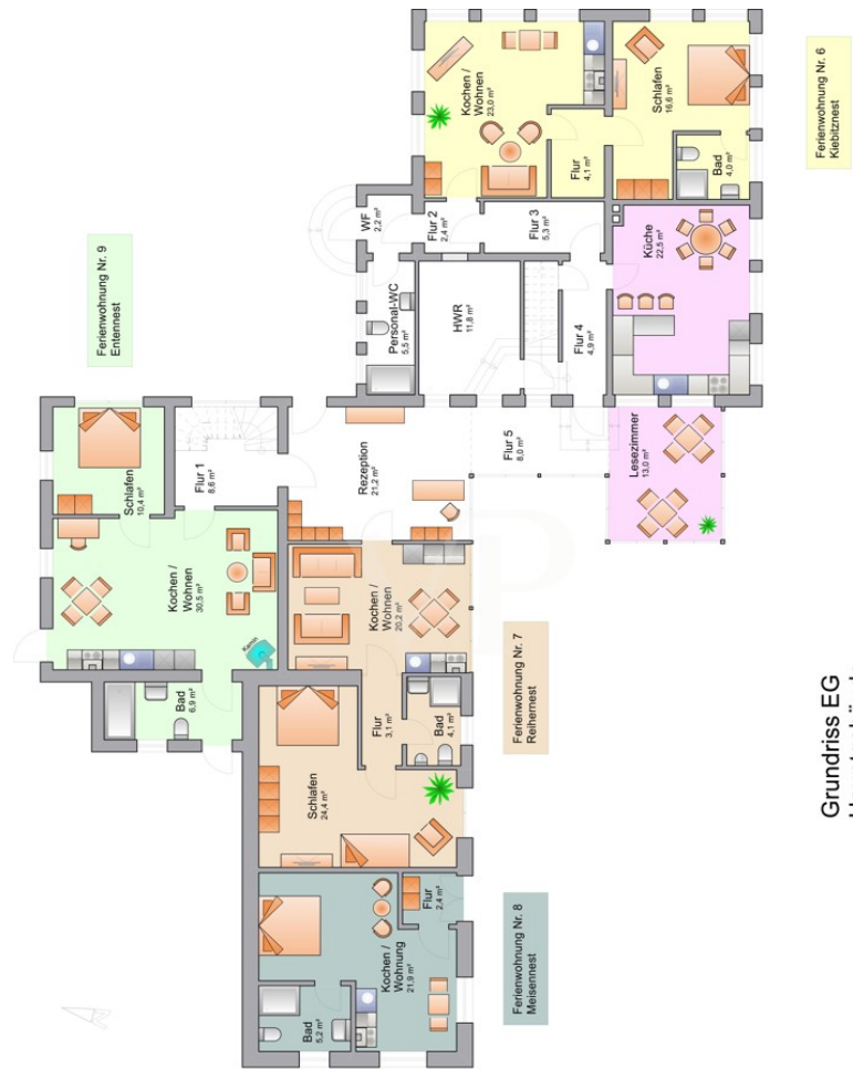
Grundriss EG Hauptgebäude