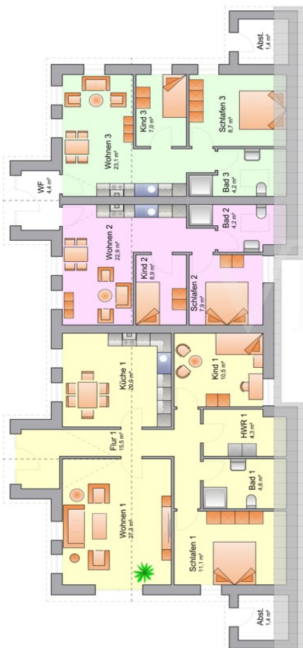
Grundriss EG Nebengebäude